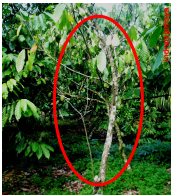
Gambar 4. Batang utama dan cabang tanaman kakao mati